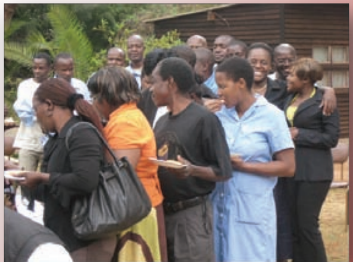
Le personnel de Zichire profitant de la partie de thé organisée