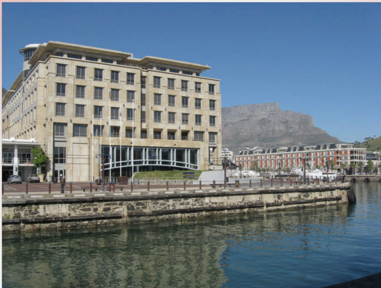
Ci-dessus: la place de la Conférence à Waterfront à Cape Town avec la « Table Mountain » en arrière plan

Les sessions plénières couvriront les tests de diagnostic rapides, la prévention de la transmission materno-foetale du VIH, les pilotes biologiques de l'épidémie du VIH, les réseaux sexuels et l'internet, la circoncision, les vaccins contre le VIH et l'utilisation de la technologie de l'information de manière à améliorer la pratique clinique en IST/VIH. Les symposiums couvriront des sujets relatifs aux hommes ayant des rapports sexuels avec des hommes (HSH), au typage des bactéries en ISTs, aux interventions de santé publique sur les ISTs/VIH, aux approches de traitement du VIH, au condom, aux interventions comportementales et ISTs/VIH en Afrique, au développement des tests rapides de dépistage de la syphilis chez les femmes enceintes, à la mise à jour sur les ISTs et l'informatique, aux défis d'une prise en charge syndromique efficace des ISTs, aux vaccinations et à la maladie clinique de l'HPV, au travail du sexe, au traitement des ISTs comme composante de la prévention du VIH et finalement aux défis mondiaux de l'IUSTI. La conférence prendra fin avec une session de clôture par le Professeur King Holmes de l'Université de Washington (Seattle, USA) sur les stratégies émergentes multi-composantes de prévention des ISTs/VIH. À la fin de la rencontre, Professeur Holmes prendra du Professeur Angelika Stary, la fonction de président mondial de l'IUSTI.