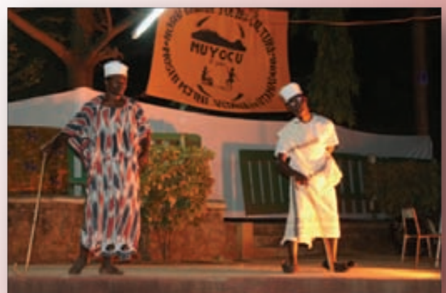
Les jeunes, présentant leur pièce sur l'esclavage