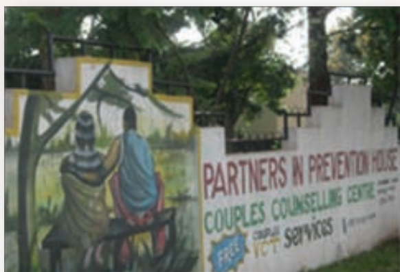
Site de conseils aux couples, dans le cadre de l'essai « Partenaires dans la Prévention de la transmission du VHS/VIH »

Les résultats de cet essai qui manqua de montrer un avantage de la thérapie de l'acyclovir suppressif en termes de transmission du VIH à un partenaire séronégatif, suivent d'autres essais cliniques récemment publiés en Afrique et dans d'autres parties du monde, qui manquèrent de montrer un avantage protecteur contre l'acquisition du VIH chez des femmes et des hommes ayant des relations sexuelles avec des hommes (HSH) séronégatifs et porteurs de HSV2. Une analyse additionnelle des données de ces essais cliniques randomisés s'avère nécessaire pour essayer de comprendre les résultats à la lumière de la solide preuve épidémiologique pour un rôle de cofacteur du HSV2 dans la transmission du VIH.