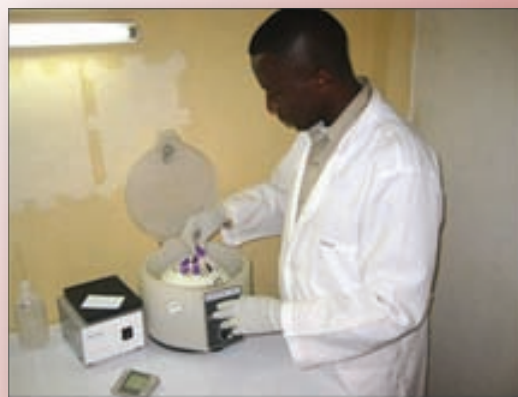
Technicien de laboratoire traitant des prélèvements sanguins dans le cadre de l'essai

Les informations dans cet article sont rendues disponibles dans la publication de Presse de l'Université de Washington le 08 Mai 2009. Pour d'autres informations de media, contactez Clare Hagerty clareh@u.washington.edu ou Mary Guiden mguiden@u.washington.edu à l'Université de Washington aux USA.