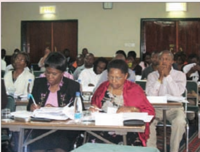
Les participants en plein cours

Plus de 60 délégués se sont inscrits comme membres associés de l'IUSTI-Afrique pendant les deux jours du cours.