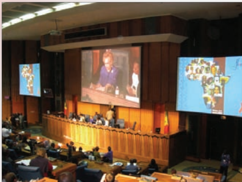
L'auditorium principal de la 15ème CISMA