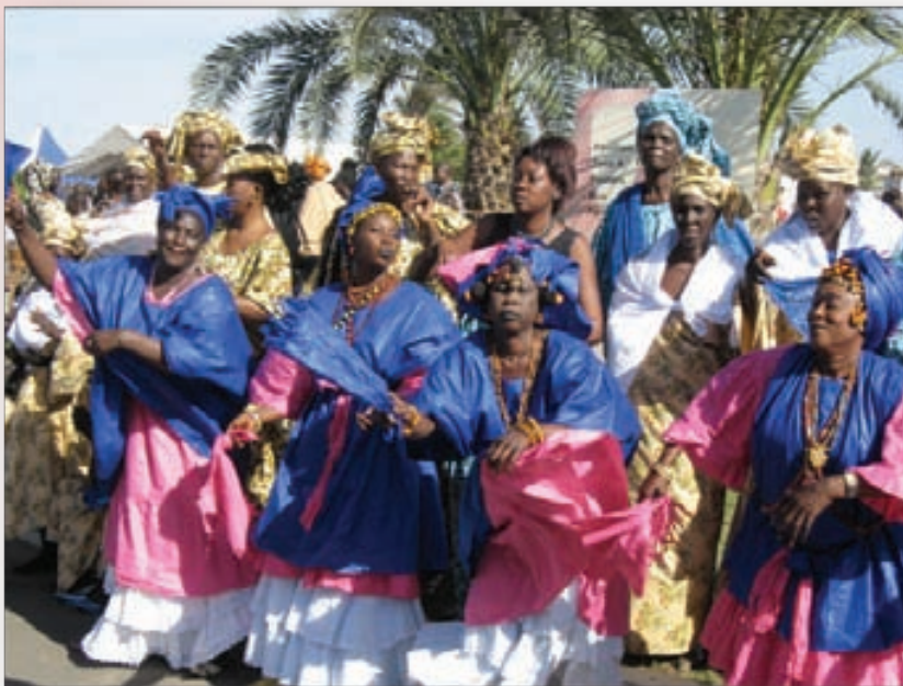
Danseuses sénégalaises, dehors sur la place de la conférence, le jour de l'ouverture