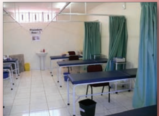
Le pavillon chirurgical au centre de circoncision masculine de Bophelo Pele

Le projet de Bophelo Pele est conçu pour être un modèle sain et rentable pour lancer la chirurgie à grande échelle comme une intervention de santé publique dans un environnement semi-urbain où un volume élevé de chirurgie est demandé. Ce projet démontre que la mise en oeuvre de la circoncision chez l'adulte peut être faite de manière saine et non onéreuse selon les recommandations internationales.