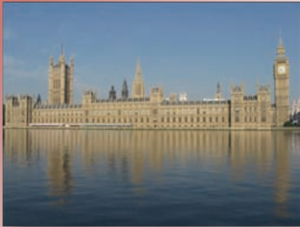
La Chambre du Parlement à Londres