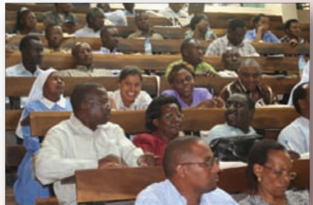
Les délégués à la conférence