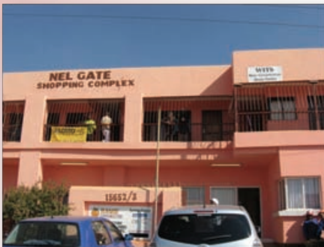
Le centre de circoncision masculine de Bophelo Pele dans la ferme d'orange

Avec la composition de cette équipe six à dix circoncisions masculines peuvent être faites par heure avec un temps chirurgical moyen de sept minutes et demie par circoncision masculine et un temps de procédure total de 20 minutes. Après la chirurgie, les participants reçoivent des instructions orales et écrites post opératoires. Les visites de suivi sont effectuées dans une chambre privée au centre chirurgical aux deuxième et septième jours après la chirurgie. Les participants qui ont raté une visite de suivi reçoivent des rappels téléphoniques. Les demandes des patients pour la circoncision masculine vont de 30 à 100 par jour.