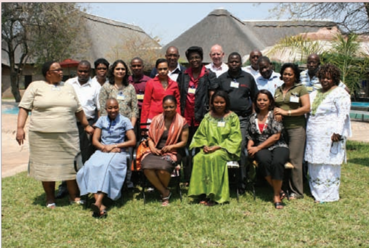
L'équipe technique et le personnel du Secrétariat de la SADC.